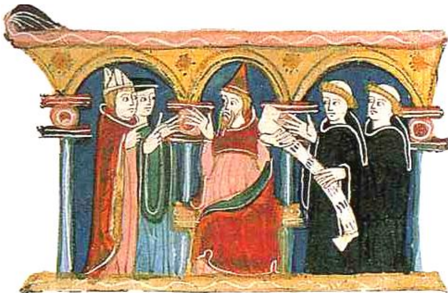
Le pape confie aux Dominicains la répression contre les cathares. (miniature du XIV e siècle)